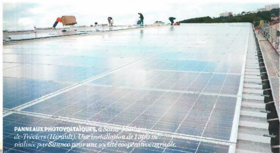
PANNEAUX PHOTOVOLTAÏQUES, à Saint-Martin-de-Trézières (Hérault). Une installation de 1 350 m 2 réalisée par Sunnco pour une société coopérative agricole.